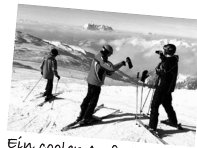
Ein cooler Auftakt,...