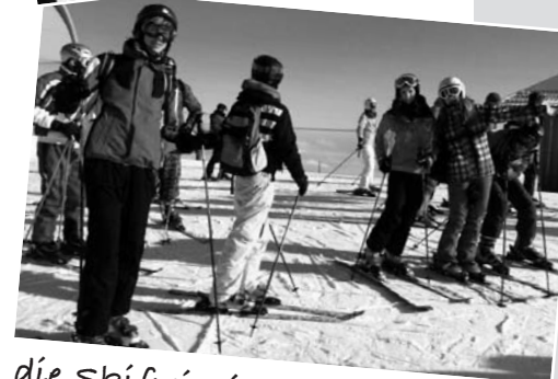
die Skifreizeit 2012