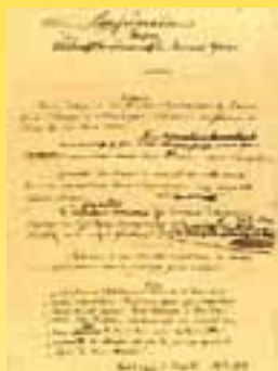
Pariser Basis von 1855

„Die Christlichen Vereine Junger Männer haben den Zweck, solche jungen Männer miteinander zu verbinden, welche Jesus Christus nach der Heiligen Schrift als ihren Gott und Heiland anerkennen, in ihrem Glauben und Leben seine Jünger sein und gemeinsam danach trachten wollen, das Reich ihres Meisters unter jungen Männern auszubreiten. Keine an sich noch so wichtigen Meinungsverschiedenheiten über Angelegenheiten, die diesem Zweck fremd sind, sollten die Eintracht brüderlicher Beziehungen unter den nationalen Mitgliedsverbänden des Weltbundes stören.“ (Paris, 1855)